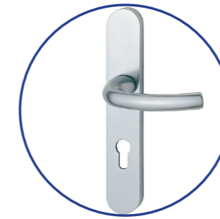
Poignée de porte d'entrée